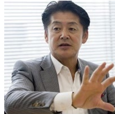
こと京都株式会社 代表取締役 公益財団法人 日本農業法人協会 会長