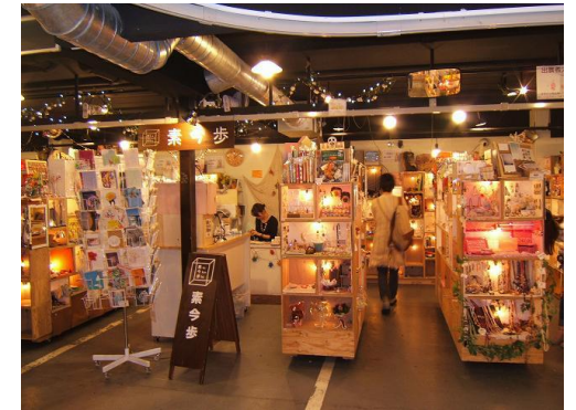
ファーマーズ・チェストイメージ

生産者さんにとって、ファーマーズマーケット出店は、実は結構大変なこと。ファーマーズ・チェストでは、生産者さんが選びぬいた一品を詰めたチェスト（箱）を宝箱のように展示販売するエリアです。価格や説明文などは生産者さんがつけたものですので、直接生産者さんと繋がっているように選ぶことができます。